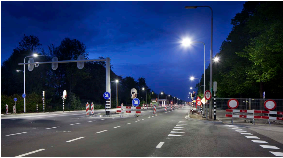
De 'nieuwe' Utrechtsweg ter hoogte van de Veldzichtlaan

wordt gestart in het laatste wegvak (Kerklaan-Universiteitsweg). Mogelijk knelpunt zijn de procedures tbv de bouwvergunning voor de bruggen Wilhelminalaan/KNMI.